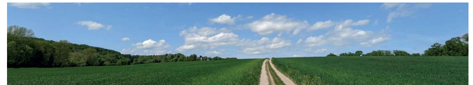
N. Schwarz © GemeindebriefDruckerei.de