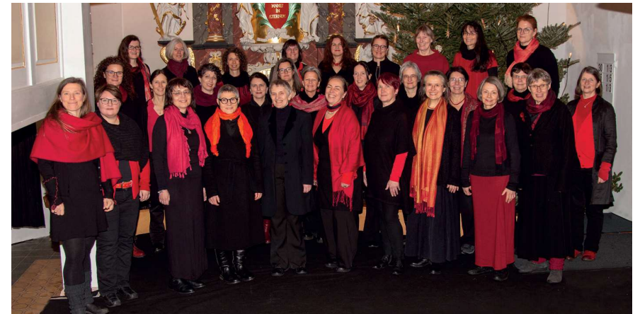
Es sangen drei Engel